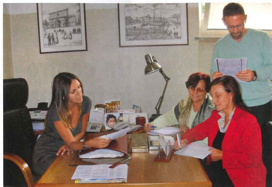
Alla Clinica Latina, dove è sempre stato riservato ampio spazio alla professionalità femminile, un team di dottoresse è oggi ai vertici della Direzione Sanitaria e della Direzione Amministrativa.

Abnegazione, dedizione e ricerca costante di sempre più alti traguardi in tema di qualità: Clinica Latina, gestita da uno staff di professionisti competenti e attenti ai valori dell'etica, è da anni apprezzato punto di riferimento in campo riabilitativo